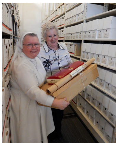
Arrivée des documents le 25 octobre 2017