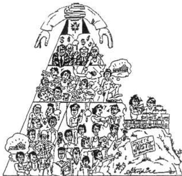
Dessin de S. Hénalre dans Pratiques de conscientisation 2 . Québec, Collectif québécois d'édition populaire, 1987.