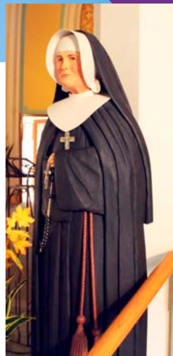
Statut en bois de Mère Marie Léonie

Au boisé d'Élodie. C'est un moment historique pour elles mais, malgré le temps qui fait son œuvre en marquant leur corps de sa trace, leur cœur et leur âme témoignent d'une grandeur et d'une jeunesse éternelle. À l'exemple de la paix et de la joie de vivre qui embaument l'intérieur de leurs murs, j'ai la certitude que la nouvelle maison sera habitée de cette même présence Divine, accueillante et bienveillante.