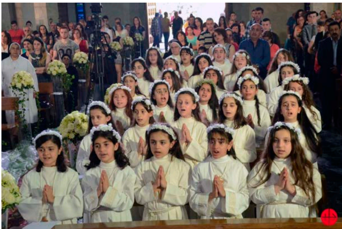
Première communion d'enfants irakiens et syriens réfugiés, à la paroisse Saint-Joseph -Beyrouth