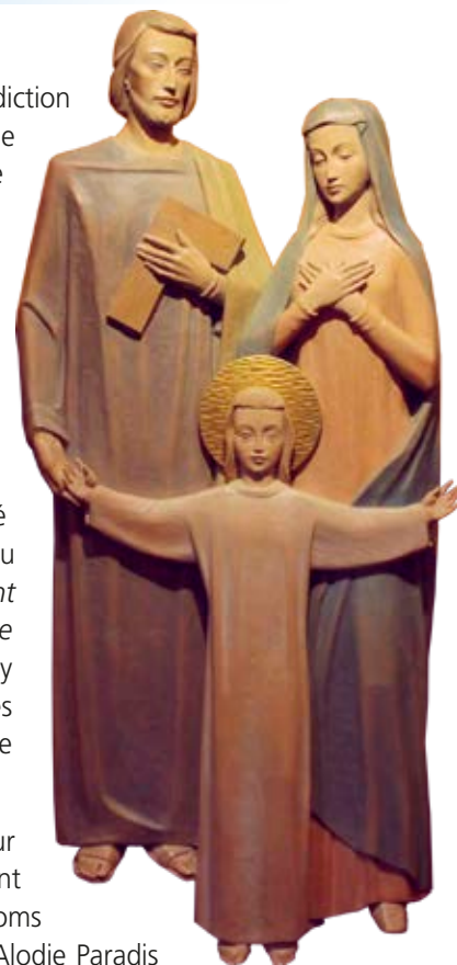
Sculpture de la sainte Famille