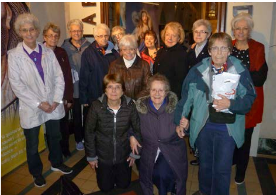
Groupe de pèlerins