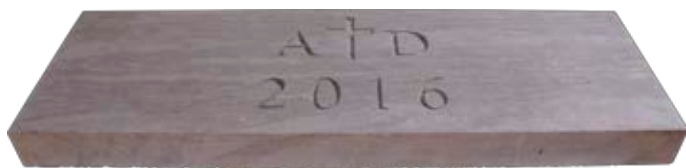
Pierre angulaire de la maison Au boisé d'Élodie

1 251 médailles bénites que les religieuses de la maison ont données, afin d'en déposer un peu partout à l'intérieur du béton. Le responsable de la santé et sécurité du chantier s'est chargé de cette tâche avec minutie. Ceci dans le but d'imprégner le nouveau bâtiment de l'âme et de la foi de ses occupantes.