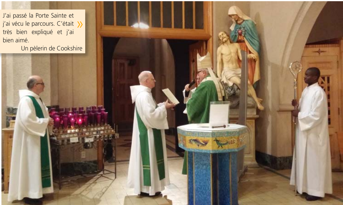
Cérémonie de clôture du Jubilé de la miséricorde