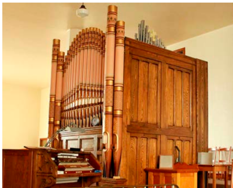
Orgue Casavant de la chapelle