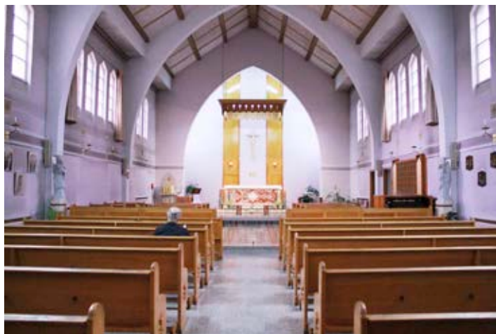
Chapelle des Sœurs du Saint-Sacrement

Nous avons eu la visite de 37 groupes de pèlerins, venus vivre l'expérience du parcours, et qui sont repartis en laissant de magnifiques témoignages. Le nombre total de croyantes et croyants qui ont franchi la Porte de la miséricorde et complété le parcours est toutefois incalculable. Mais la réponse du public à notre invitation et la provenance des différents visiteurs dépassent largement toutes nos attentes.