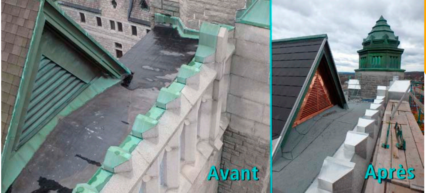
Remplacement de l'aérateur de cuivre, des solins métalliques et du revêtement

des bâtiments s'imposent. N'oublions pas que le coût total des travaux était évalué à 8,5 millions de dollars. Ce dernier coup de barre semble plus difficile à donner, car les dons se font plus rares. Cependant, la détermination des acteurs qui entourent ce projet ne se dément toujours pas.