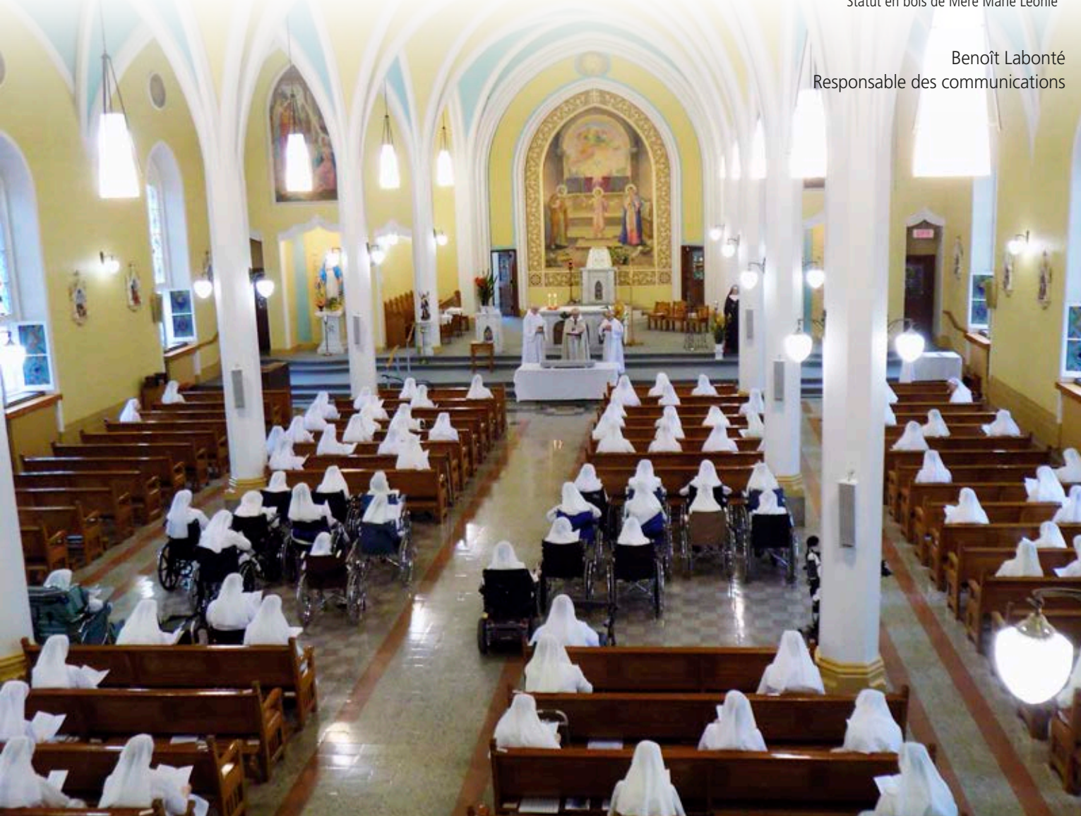
Cérémonie de bénédiction de la Pierre angulaire